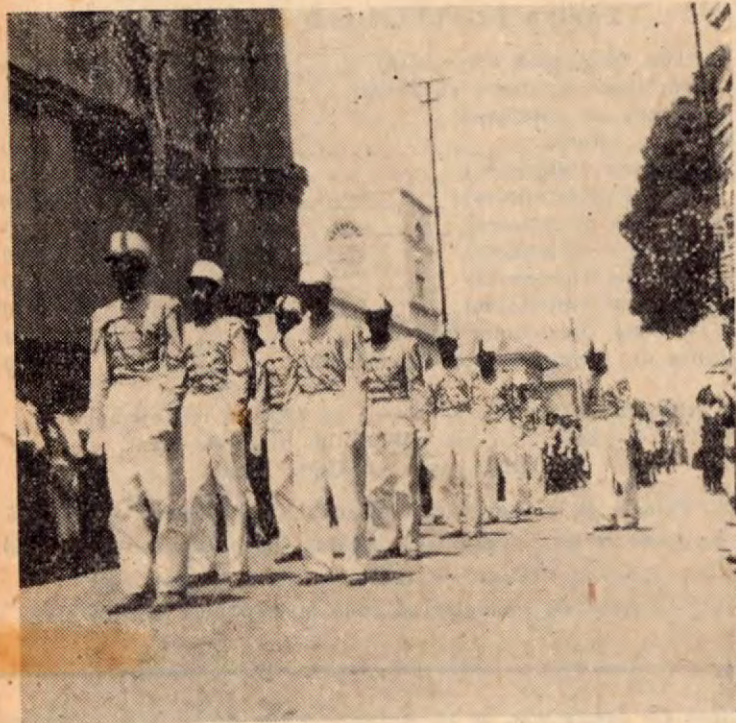
De no haber sido tan oportuno este generoso concurso en la gallarda defensa de nuestras libertades por el ejército costarricense, Nicaragua y C. R. y posiblemente todo Centro América, gemirían llenas de dolor y oprobio a los pies del bucanero invasor.

MORA, CAÑAS, SANTAMARIA, tríptico glorioso de la épica jornada. La fervorosa lealtad de estos hombres que escucharon el grito de la patria centroamericana angustiada y en peligro, tiene un claro sentido epopéyico que recuerda los héroes de la Iliada.