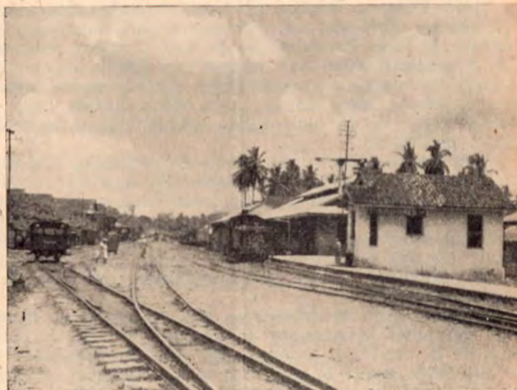
Patio del Ferrocarril y calle de Siquirres.